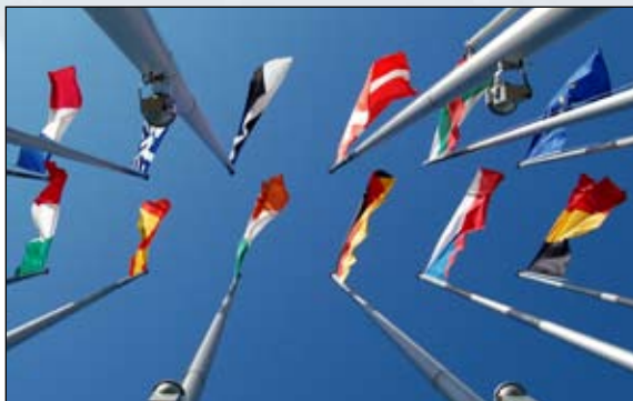
Dossier: de 'vergeten' talen van Europa (p. 4)