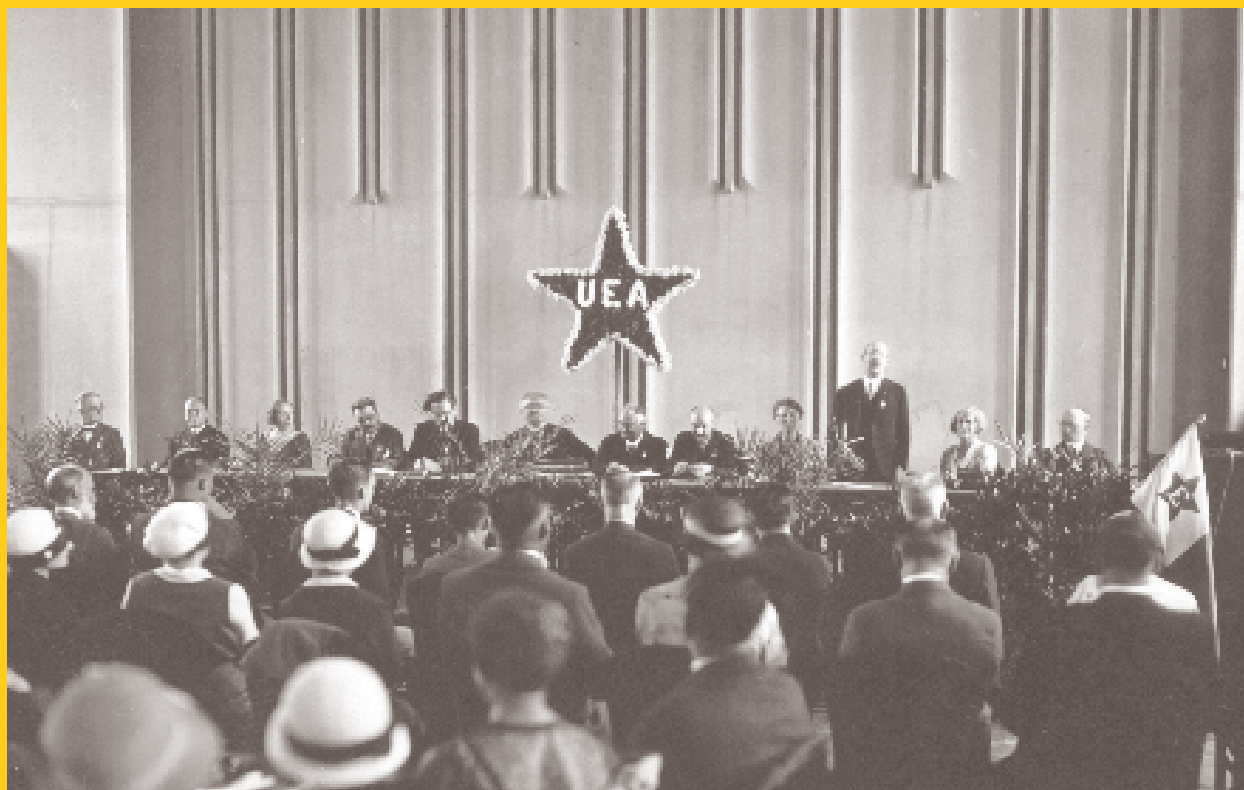
Universala Kongreso 1933