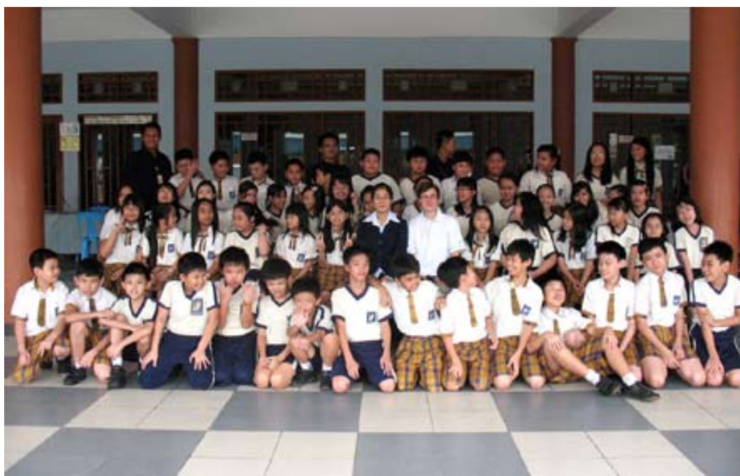
Batam, 9a de novembro

La unuaj esperantistoj en la nuna Indonezio estis, komence de la antaŭa jarcento, krom kelkaj britoj,