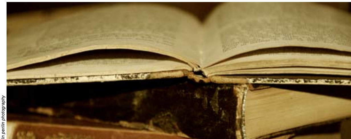
lin perlin photography