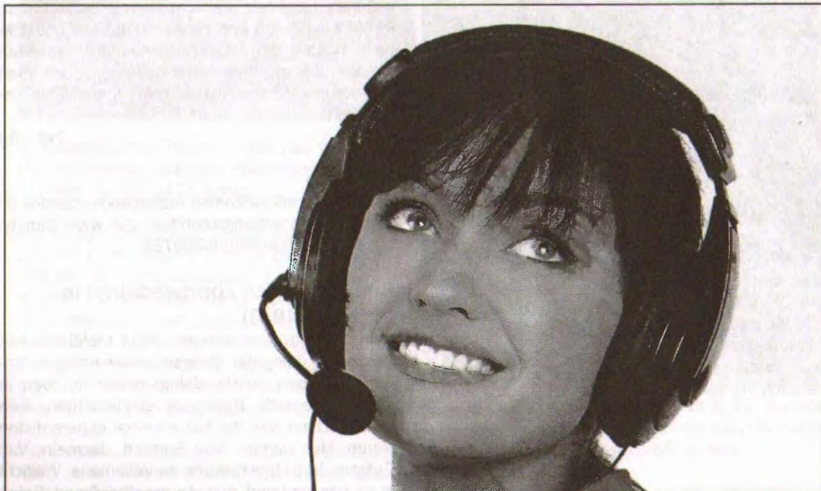
Honderden callcenters in Turkije werken voor Duitse bedrijven.

ken tekst van de Duitse docent omzet in geschreven tekst, en daarna vertaalt naar het Engels. Studenten die weinig of geen Duits kennen, kunnen zo op hun computer lezen wat de docent zegt. Bij een demonstratie begin juni waren de resultaten verre van perfect, maar Duits wordt als een van de moeilijkst te leren talen beschouwd. Het pro-