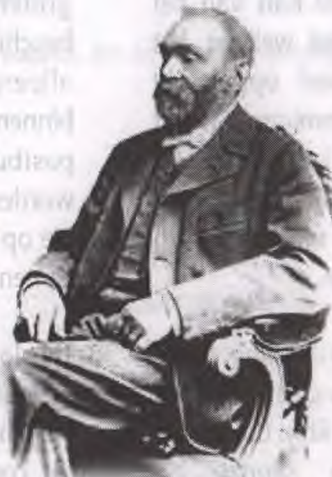
Alfred Nobel (1833-1896)

Laten we om te beginnen het verhaal bekijken. In het jaar 1577 werd het meisje Beatrice Cenci geboren, die in 1599 geëxecuteerd werd wegens moord op haar vermoedelijke vader Francesco Cenci (1549-1598). Samen met