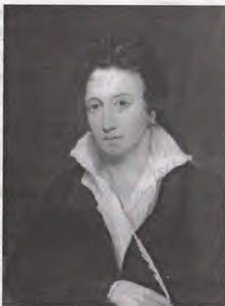
Percy Bysshe Shelley (1792-1822)

die dezelfde geschiedenis ten tonele voerde. Hij deelde met Nobel zijn afkeer van de rooms-katholieke kerk en haar geschiedenis; maar anders dan Nobel, behandelde hij de waarden van haar leerstellingen niet. De beroemde Italiaanse schrijver, Alberto Moravia, publiceerde in 1958 zijn werk "Beatrice Cenci", eveneens over dezelfde reeks gebeurtenissen.