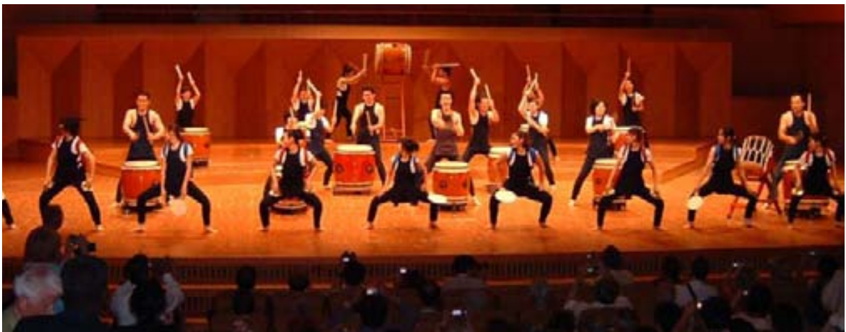
Een essentieel deel van het programma is ook steeds de plaatselijke cultuur. Hier: UK in Yokohama (Japan) - nacia vespero

Veel mensen combineren ook de deelname aan een internationaal congres met een (rond)reis in het land, waarbij men vaak thuis bij Esperantosprekers overnacht.